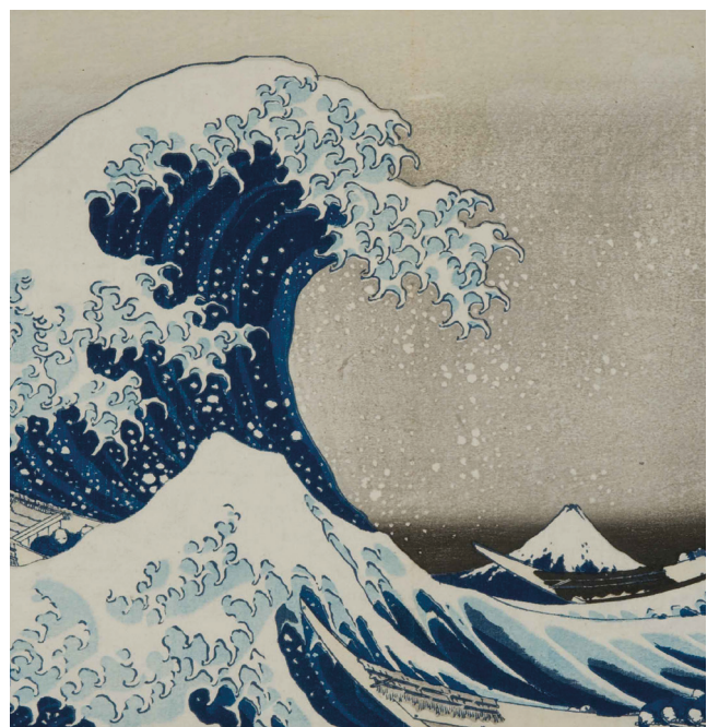
La Grande Vague de Kanagawa de Katsushika Hokusai

Une animation pour le jeune public 7/11 ans est proposée dans le cadre de l'exposition Hokusai.